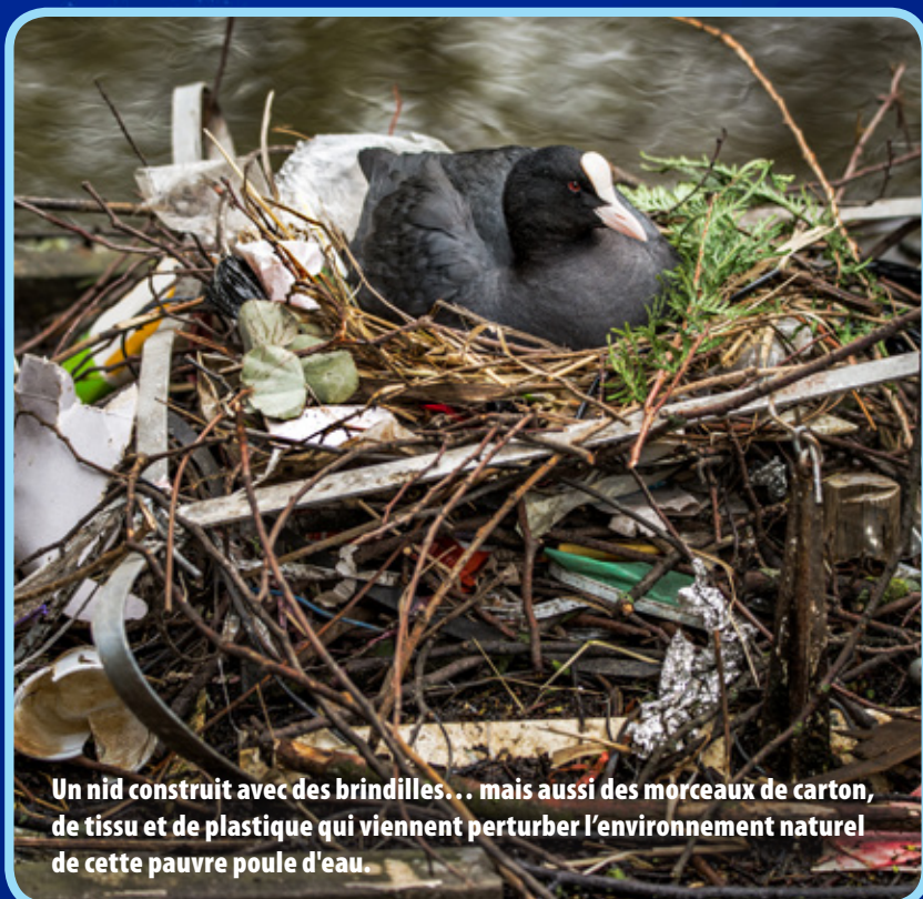
Un nid construit avec des brindilles... mais aussi des morceaux de carton, de tissu et de plastique qui viennent perturber l'environnement naturel de cette pauvre poule d'eau.

Denis Ody nous parle de ses observations en mer : « En plus des accidents avec les navires, les animaux sont empoisonnés par le plastique que l'on retrouve dans l'eau, comme des sacs ou de petits objets avec lesquels ils s'étouffent. Les plastiques se décomposent peu à peu jusqu'à devenir invisibles à l'œil nu. Des bactéries, des virus ou des larves d'animaux se fixent sur ces micro-plastiques et les entraînent vers d'autres régions, où elles se multiplient et perturbent les écosystèmes. »